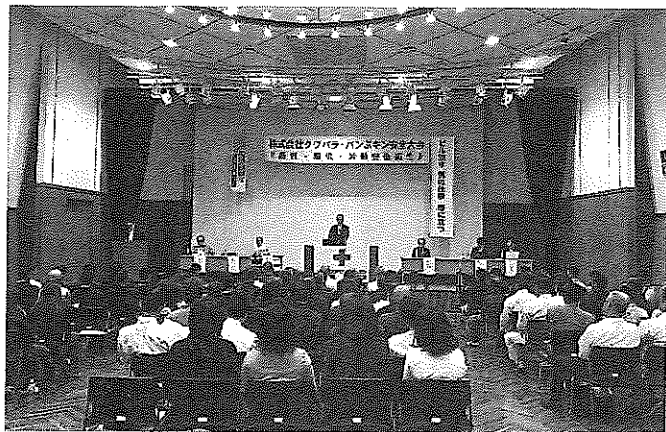
役員や社員など約100人が参加した

業計画の進捗などに触れた後、前回の大会で発表した経営理念『価値ある未来と環境を創造する』(和文)に、英文『Think Future & Environment』の表現も加えたことを伝え、今後は両方使用していく旨を発表。 さらに人事評価制度導入や進捗状況について述べた後、働き方改革による先の週休2日制を見越して、皆が安心して働けるよう、60